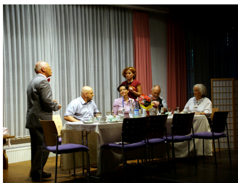
Das Foto zeigt eine Szene einer früheren Aufführung des "75. Geburtstag".

Schutzmaske betreten. Später gibt es dann auch noch Restkarten an der Abendkasse.