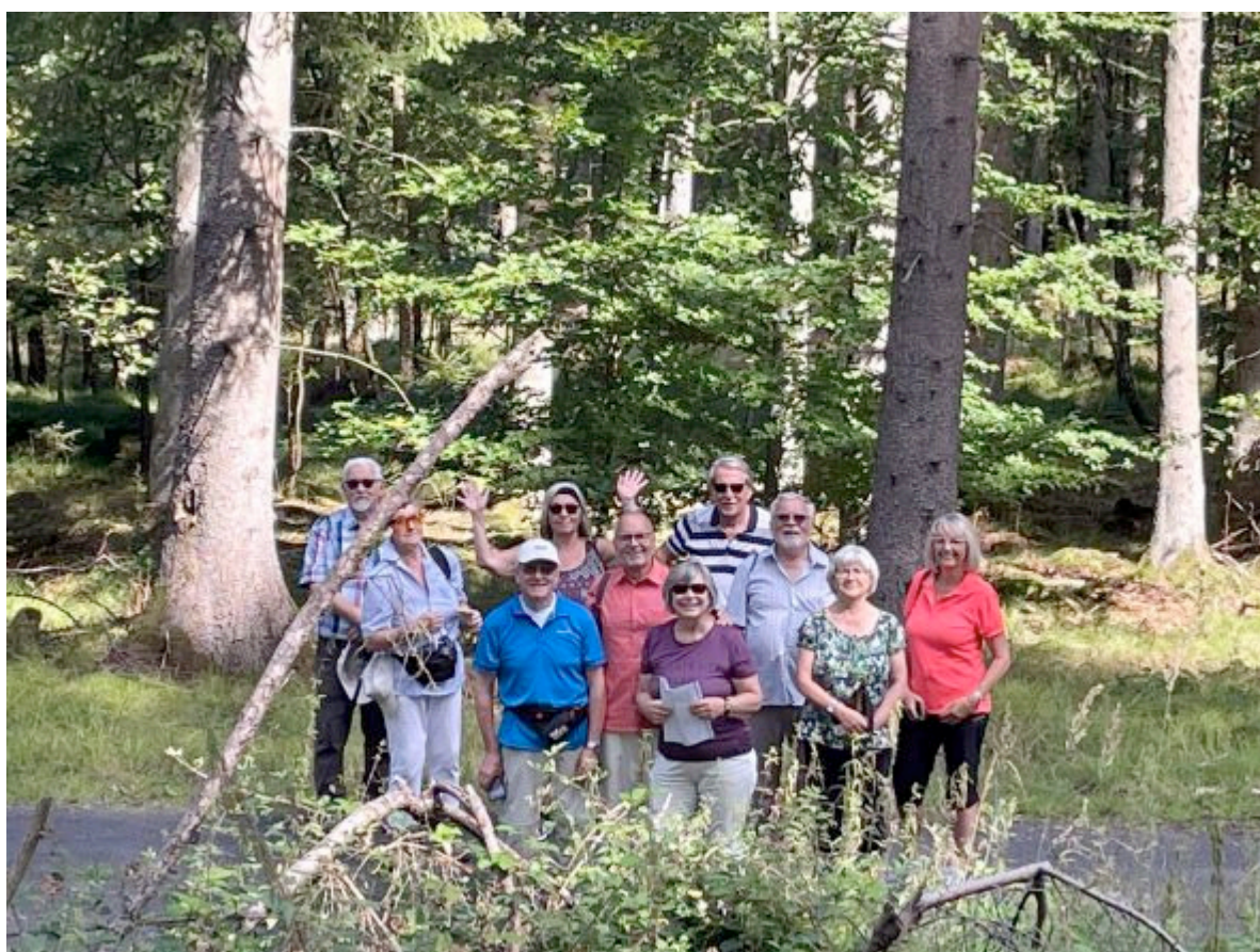
Das Foto zeigt die Wanderer im August im Büdinger Wald

Die September-Wanderung der Wanderabteilung des TV Jahn startet am Sonntag, den 19.9.2021, in Usenborn. Sie beginnt am Friedhof am Totenweg und von da geht es auf den ca. 9,5 km langen „Psalmenweg“ rund um den kleinen Ort. An elf besonderen Stationen kann man innehalten und neben einem passenden Psalmtext Natur und Fernsicht genießen. Treffpunkt und Abfahrt mit Privat-PKW ist wie üblich um 9:00 Uhr an der Gemeindehalle. Die nächsten Wanderungen sind dann vorgesehen für Sonntag, den 17.10., in Ockstadt (8 km) und Sonntag, den 7.11., in Steinheim am Main (11 km). Da diese Termine sich noch verschieben können, sollten unbedingt die Ankündigungen hier beachtet werden.